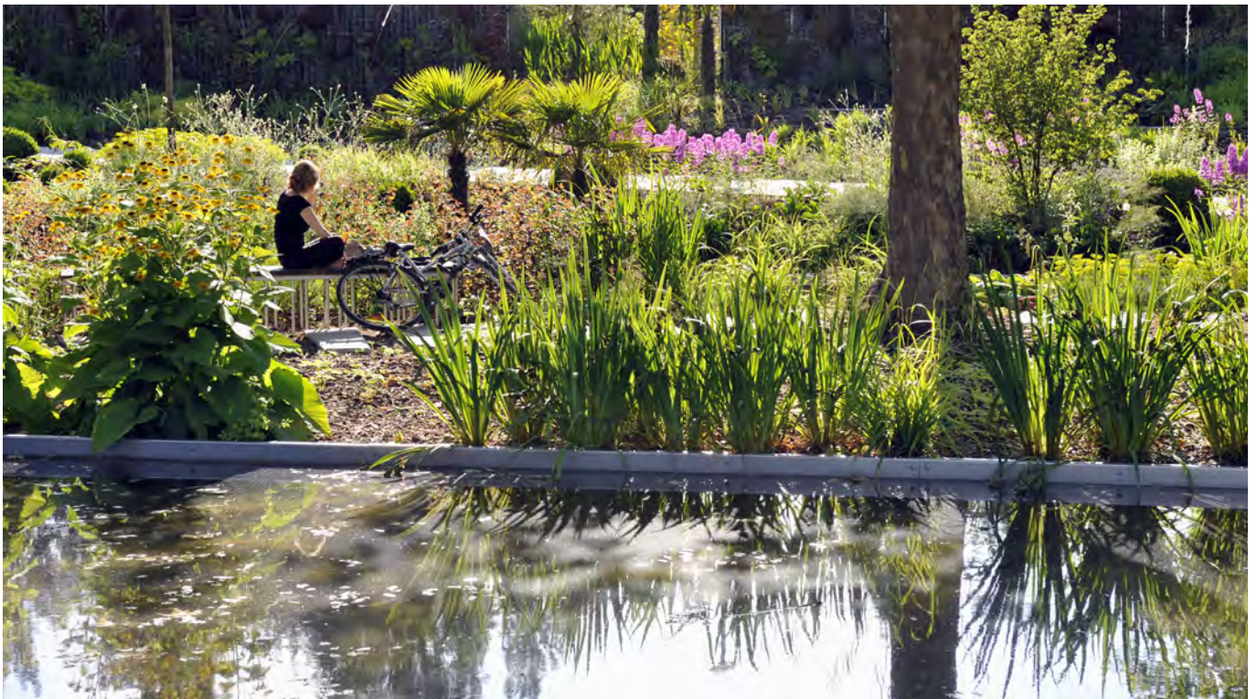
1. Intensités à l'intérieur du jardin